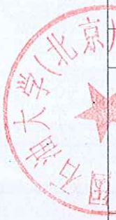
2017 年申报硕士研究生指导教师人员近四年学术成果表