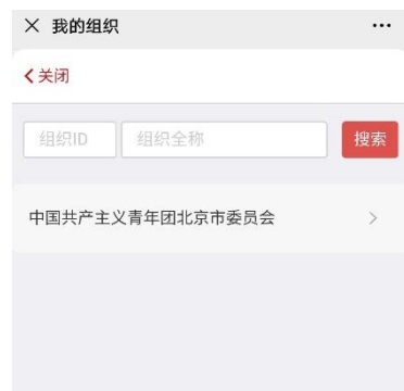
京内组织搜索界面