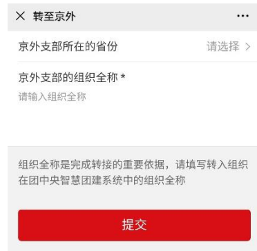
京外组织搜索界面