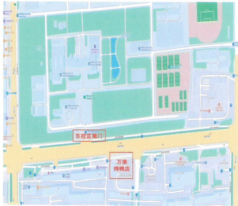
东校区对面用餐位置图