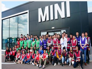
宝马 MINI 工厂