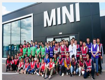
宝马 MINI 工厂

学员将有机会走进具有悠久历史的英国企业：剑桥科技园、宝马 MINI 工厂等，了解行业特点、感受现代科学技术、领悟全新的管理模式。