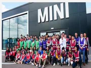
宝马 MINI 工厂

学员将有机会走进知名的英国企业，了解行业特点、领悟企业核心竞争力、感受全新的管理模式。