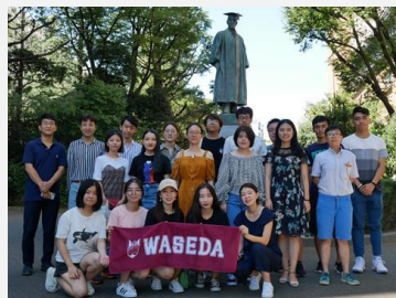
早稻田大学校园参访

项目期间，学员还将在早稻田大学与东京大学等高校进行校园参访，与当地学生交流对话，听他们分享在日本的留学生活。