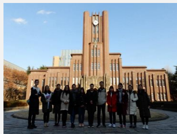
东京大学校园参访