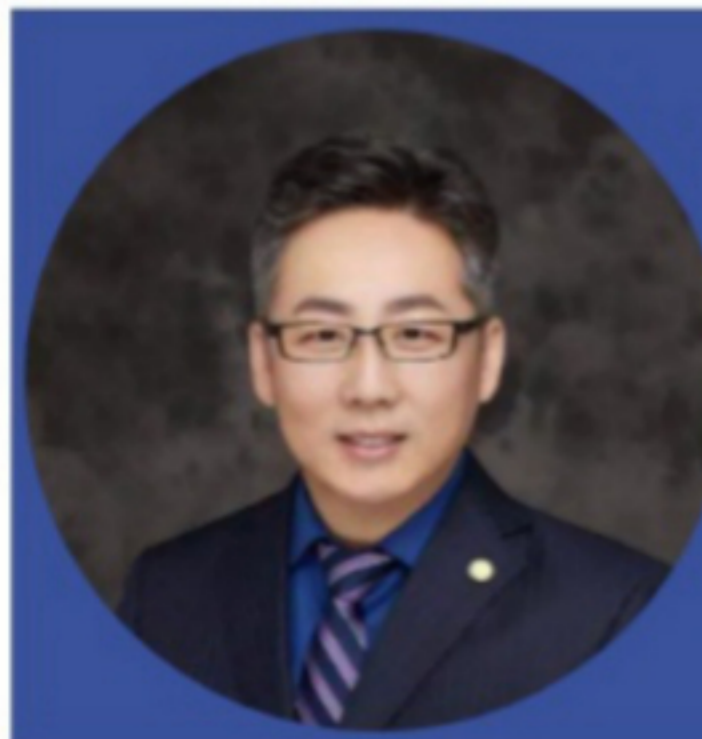
赵洱崧教授 华北电力大学 经济管理学院

哈尔滨工业大学计算机学院教授、教学委员会主任；哈尔滨工业大学MOOC推进工作办公室主任；黑龙江省教学名师；黑龙江省普通高等学校在线教学指导委员会副主任兼秘书长；教育部高等学校大学计算机课程教学指导委员会委员。获国家级教学成果一等奖1项，省级教学成果特等奖1项、一等奖2项，国家精品在线开放课程负责人。60余所大学选用其MOOC课程，累计选修人数已超100万人。受教指委、慕课联盟及100余所大学邀请，作特邀报告200余场。