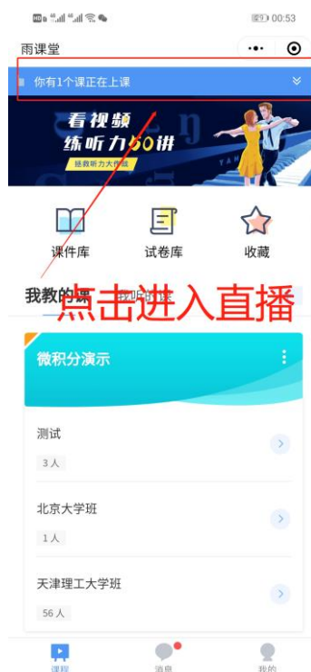
图 5 小程序进入直播界面

进入雨课堂小程序后，在小程序上方若发现有“你有 1 个课正在上课”的提示，点击该提示即可进入直播。如图 5 所示。