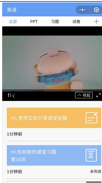
图 9 学生手机端直播预览效果