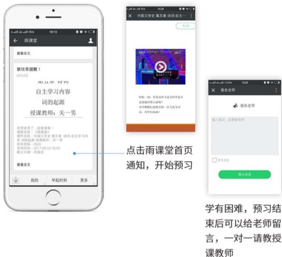
图 15 接收预习任务并完成预习

若老师给学生推送了预习资料，各位同学将在雨课堂公众号里收到相应的通知提醒，点击该提醒即可启动预习，预习之后带着思考去上课。（ 温馨提示： 请在老师规定时间内完成预习。老师能看到你什么时候完成预习，预习了哪几页等信息）