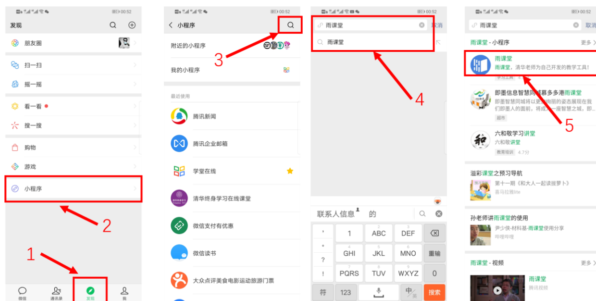
图 4 搜索进入雨课堂小程序

进入雨课堂小程序后，在小程序上方若发现有“你有 1 个课正在上课”的提示，点击该提示即可进入直播。如图 5 所示。