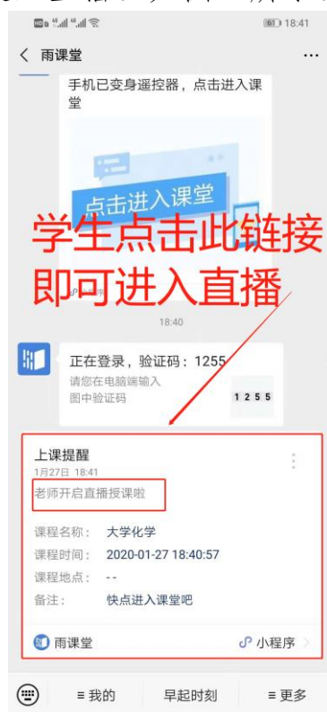
图3 学生接收上课直播提醒

(1) 教师可在开启直播时给学生发送通知，学生可在微信公众号里收到直播提醒，点击此消息即可进入直播。如图3所示。