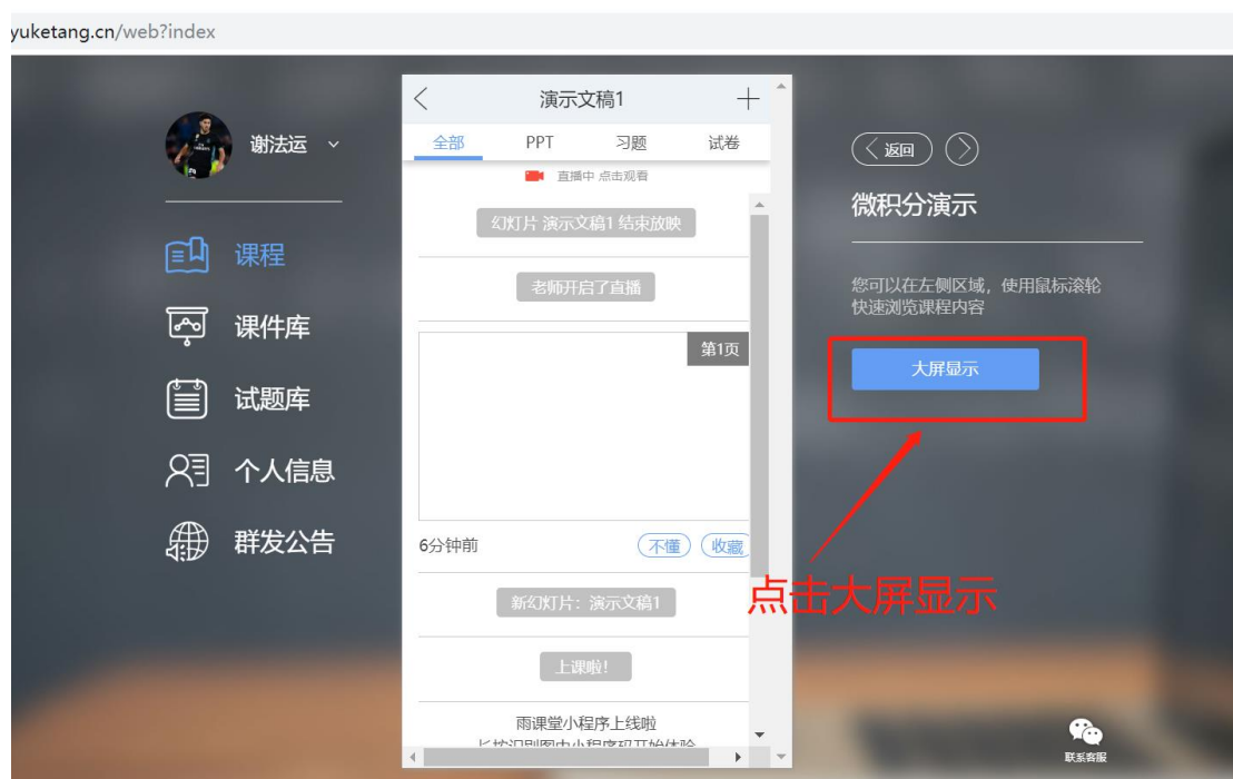
图 9 可进入大屏显示