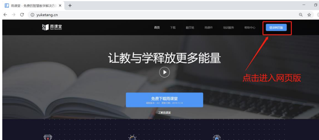
图 7 雨课堂网页版登录界面

(4) 通过浏览器进入观看直播（推荐用 Chrome、火狐、360 浏览器等）通过浏览器进入雨课堂网页版（ http://yuketang.cn ），点击右上角【登录网页版】，如图 7 所示。之后用绑定了账号的微信扫码进入课程观看页面。