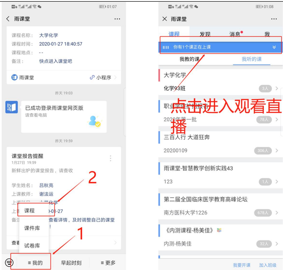
图 6 公众号进入直播

(4) 通过浏览器进入观看直播（推荐用 Chrome、火狐、360 浏览器等）通过浏览器进入雨课堂网页版（ http://yuketang.cn ），点击右上角【登录网页版】，如图 7 所示。之后用绑定了账号的微信扫码进入课程观看页面。