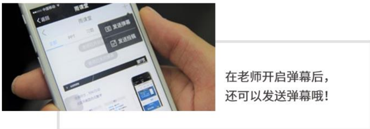
图 13 弹幕投稿操作