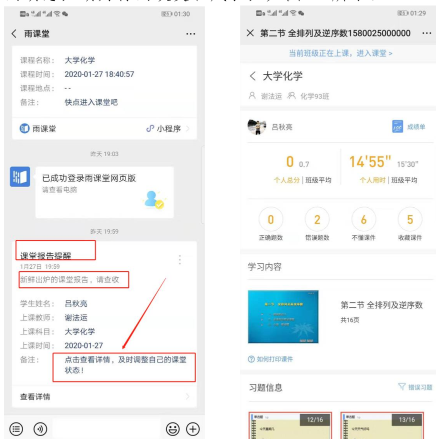
图 14 课堂报告

每次直播结束后每位同学都会收到雨课堂自动推送给大家的学习报告。错误习题、不懂课件、收藏课件、课程 PPT，雨课堂都帮各位同学整理好，关注每一节课的动态，助力你的改变和成长，如图 14 所示。