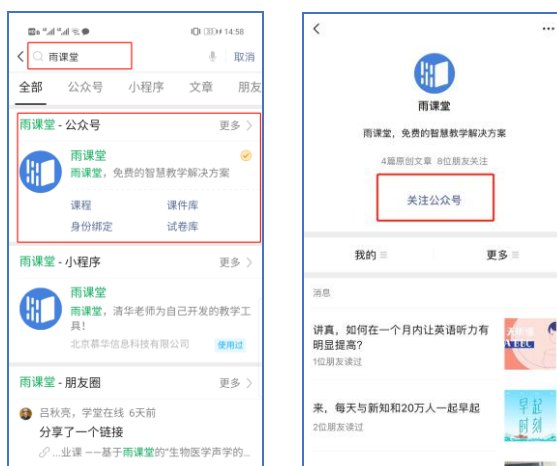
图 1 关注“雨课堂”