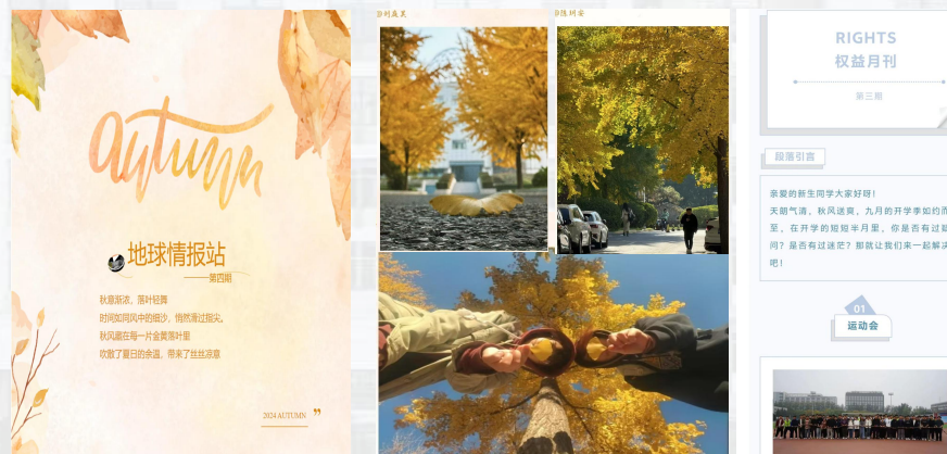
地球情报站、权益月刊、节气预告