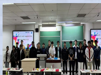
院羽毛球社团 成立大会