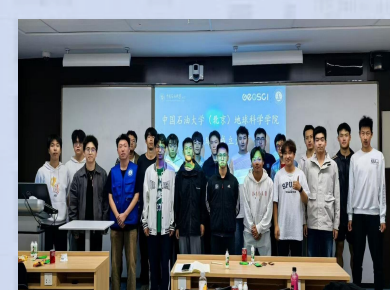
院足球社团 成立大会