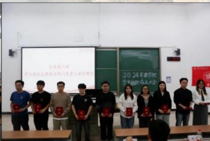
理学院第十五届研究生会部长合影