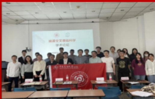
能源交叉基础科学