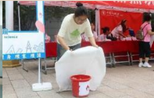
2024年度迎新工作圆满高效完成