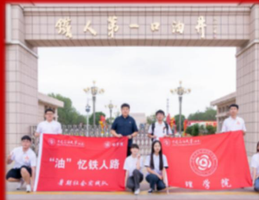
鼓励研究生参与社会实践