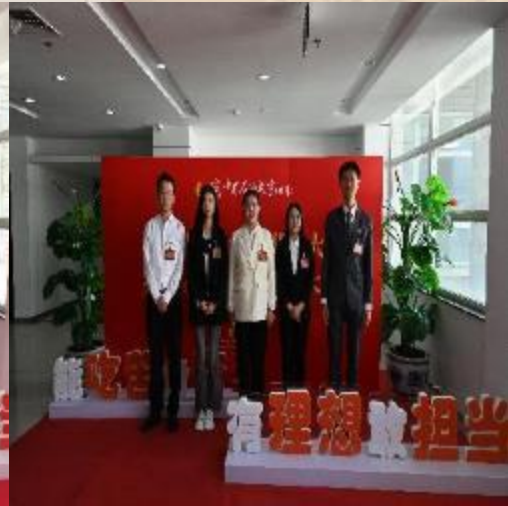
中国石油大学（北京）第八次研究生代表大会