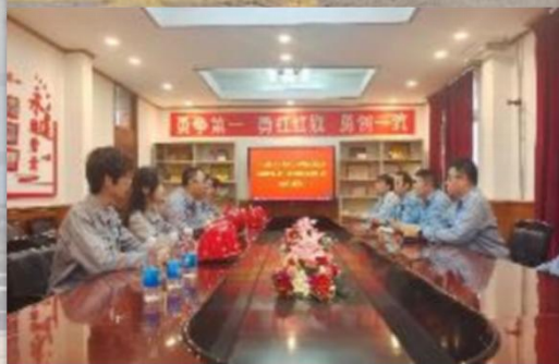
SHUANG Ma 10 NEW EDUCATIONAL CAMPUS