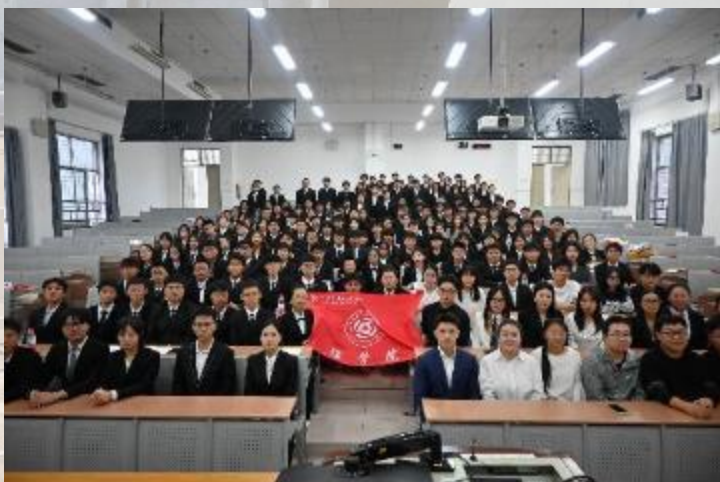
理学院第十五届研究生会成立大会