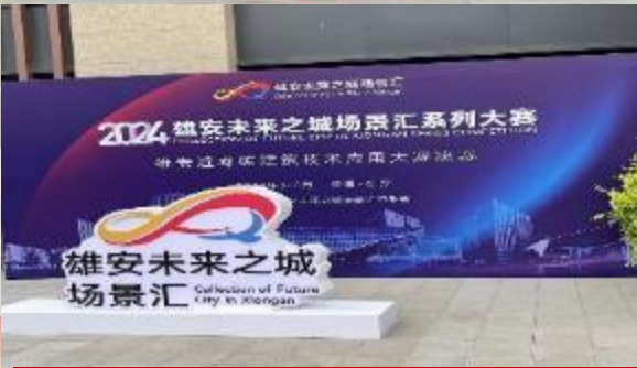
雄安新区研学活动，观摩雄安创新大赛