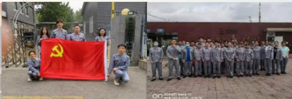
SHUANG Ma 10 NEW EDUCATIONAL CAMPUS

中国石油大学(北京) CHINA UNIVERSITY OF PETROLEUM